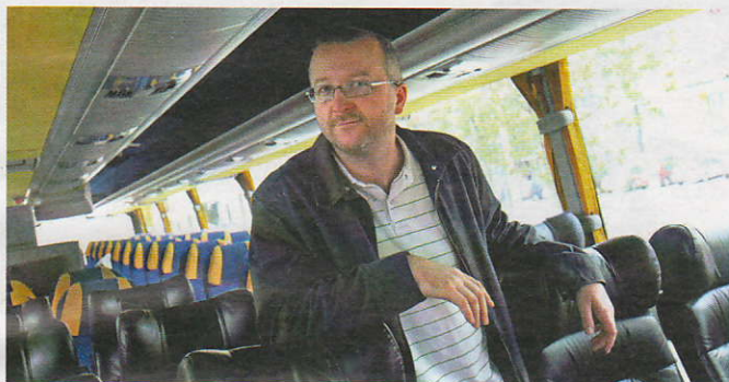
Radim Jančura je jakýmsi spojovníkem mezi Janečkem a Babišem. Přidal se k Babišovu hnutí ANO 2011 a zároveň je aktivním členem správní rady Nadačního fondu proti korupci.